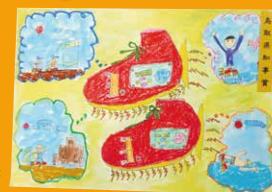
第22回鳥取県 未来の科学の夢絵画展 鳥取県知事賞 「なんでもできる ウルトラシューズ」

後援 ◆第65回鳥取県発明くふう展 鳥取県 / 鳥取県教育委員会 / 新日本海新聞社 / 日本海テレビ / 毎日新聞鳥取支局 / BSS山陰放送 / 鳥取県商工会議所連合会 / 鳥取県商工会連合会 / 鳥取県中小企業団体中央会 / 日本弁理士会 / (公社) 発明協会 ◆第23回鳥取県未来の科学の夢絵画展 鳥取県 / 鳥取県教育委員会 / (公社) 発明協会