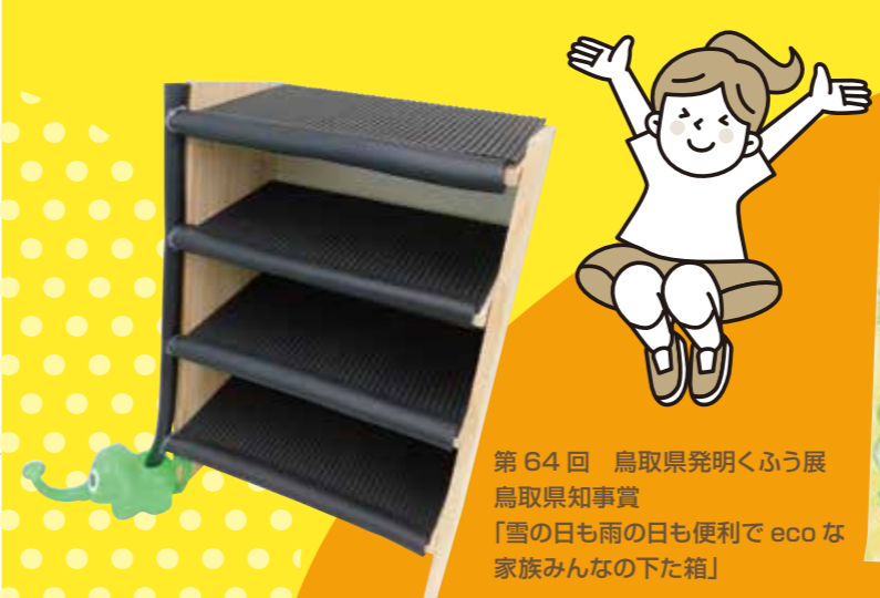
第64回鳥取県発明くふう展 鳥取県知事賞 「雪の日も雨の日も便利でecoな 家族みんなの下た箱」