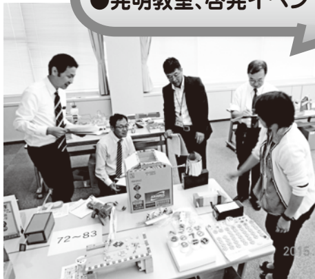
[鳥取県発明くふう展審査会の様子]