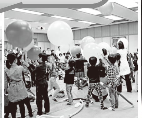
[啓発イベントの様子]