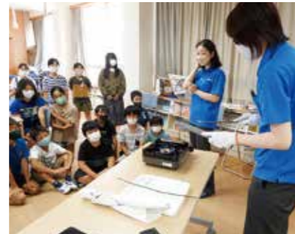
企業連携出前授業