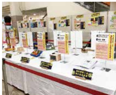
発明くふう展受賞作品展