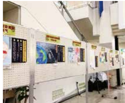
絵画展受賞作品展