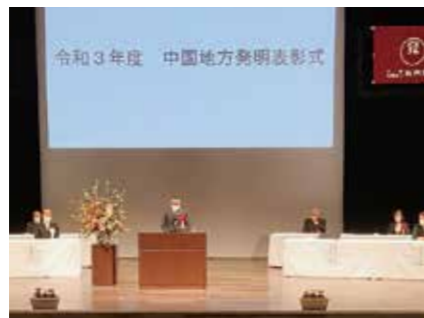
中国地方発明表彰式典