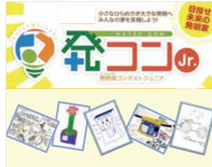
発明楽コンテストジュニア