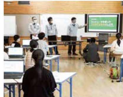
企業連携出前授業