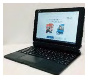
フレイル判定システム | ASTER II |

高齢者の体力測定を行い、膝や肘に痛みがある方でもできる運動をオーダーメイドで処方します。