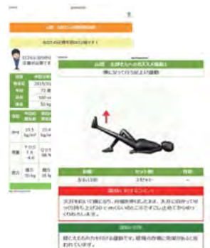
オーダーメイド運動処方プログラム 「ロコタス」online