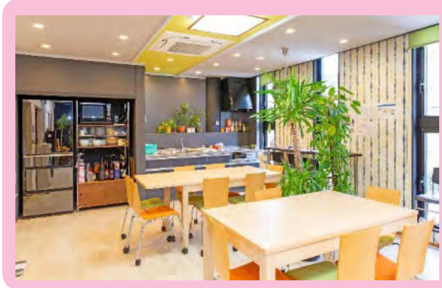
αルーム (社内コミュニケーションを深めるためのフリースペース)